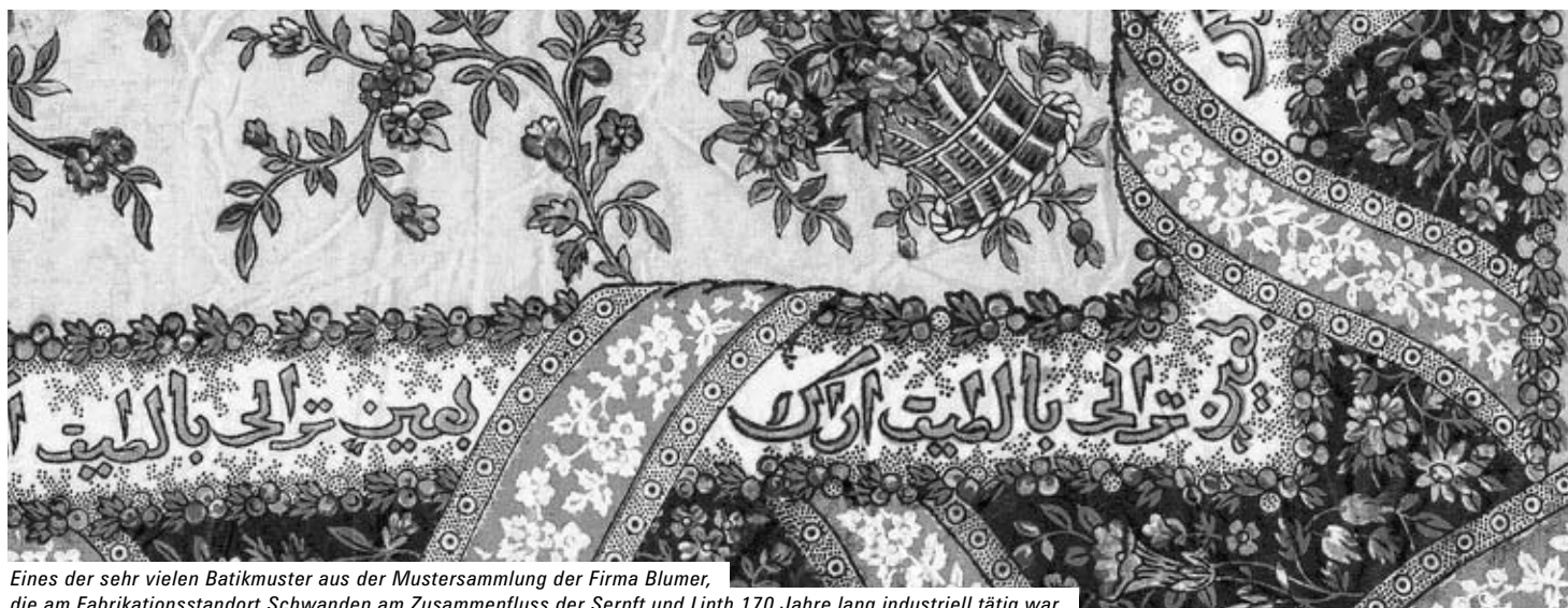
Eines der sehr vielen Batikmuster aus der Mustersammlung der Firma Blumer, die am Fabrikationsstandort Schwanden am Zusammenfluss der Sernft und Linth 170 Jahre lang industriell tätig war.

Unternehmensarchive – ein Kulturgut? Beiträge zur Arbeitstagung Unternehmensarchive und Unternehmensgeschichte, hrsg. vom Schweizerischen Wirtschaftsarchiv und vom Verein Schweizerischer Archivarinnen und Archivare, Baden, hier + jetzt Verlag, September 2006, Fr. 29.80.